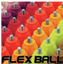
フレックスボール