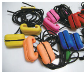
フレックスストリンガー（ストリンガー）

「Flex Trigger（フレックス トリガー）」「Flex Pull 20（フレックスプル20）」「Damper（ダンプスター）」など、性能や品質だけでなく、フレックスアーチェリーならではのカラフル