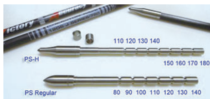
●PSレギュラーポイント / PS-Hポイント（VAP・ACE用）。VAPだけでなく「ACE」にも共通して使用できる。レギュラーポイントは最大140グレイン、H（ヘビーポイント）は180グレインの重さで使用できる。専用の「PSリング」を使えば（Hに最多2個）、5グレイン刻みのチューニングも可能。

コンパウンド用シャフト「CP204」用のポイント。 *各モデルの「H」の付くポイントは、それぞれの「レギュラー