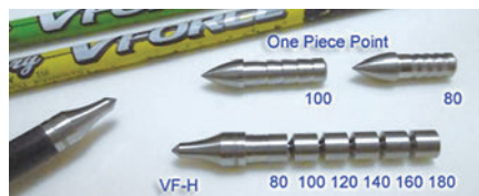
●VF-Hポイント（V-Force用）。競技用ヘビーポイント。20グレイン刻みでのチューニングが可能。