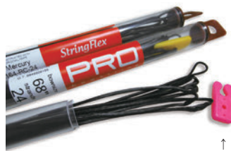
フレックスアーチェリーのストリングには、カラフルな「ストリングキーパー」が付属。

アメリカB.C.Y社の最新素材「Mercury」をベースに作られた純競技用ストリング。ダイニーマ「SK99」グレードを使用した、スピード、安定性、耐久性すべてにおいて最高性能、最高品質のストリングです。