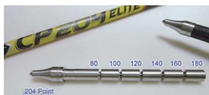
●204ポイント（CP204用）。日本人のコンパウンドアーチャー向けに開発した「CP204」シャフト用にあわせて開発した専用の競技用ポイント。20グレイン刻みでチューニングができる。

ポイント」に対して「ヘビーポイント」であることを表す。特に重いチューニングを行うときに使用してください。