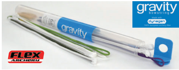
ダイナゼンを素材とした「グラヴィティ」ストリング。「ダイナゼン」はヨーロッパでアーチェリー用に生産された、最高品質の「ダイニーマ」を素材としたストリング用素材。

世界から選り抜かれた高品質、高性能な製品だけをお届けする「プロセレクトプロジェクト」。そのプロセレクトが、スタートアップ専門メーカーとしてスタートしたスペインの「Flex Archery」フレックスアーチェ